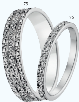
75 Alliance fantaisie diamantée polie Or blanc