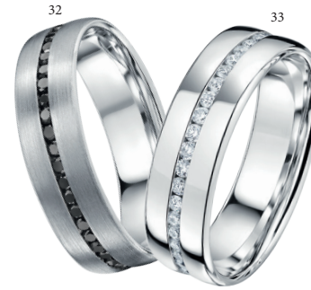
32 Alliance brossée tour complet 54 diamants 0.70 ct Or blanc