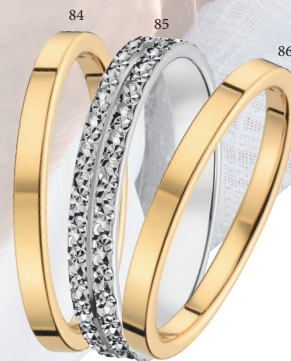
84 Alliance ruban plat confort Or jaune