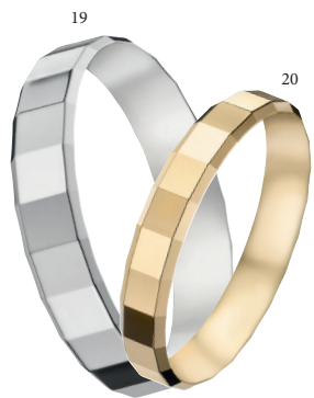
19 Alliance fantaisie polie Or blanc