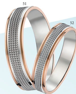
53 Alliance fantaisie Trois ors