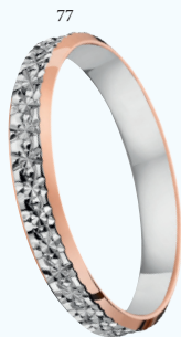
77 Alliance fantaisie diamantée polie Deux ors