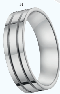
31 Alliance fantaisie polie Or blanc