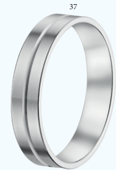
37 Alliance brossée/polie Or blanc