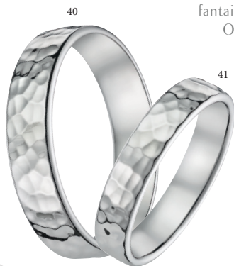
41 Alliance fantaisie frappée Or blanc