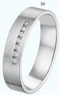
30 Alliance brossée sertie 7 diamants 0.10 ct Or blanc