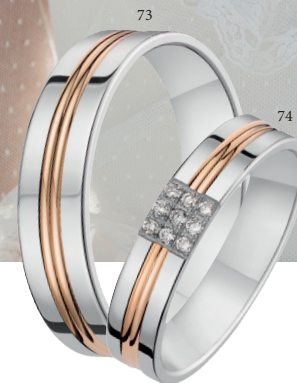
73 Alliance fantaisie polie Deux ors