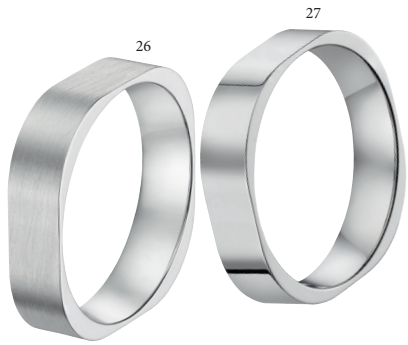
26 Alliance fantaisie brossée Or blanc