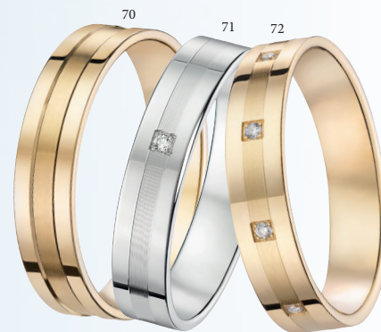
70 Alliance fantaisie polie/brossée Or jaune