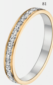
81 Alliance fantaisie diamantée Deux ors