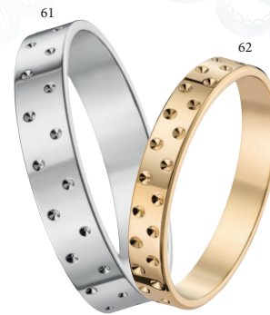
61 Alliance fantaisie polie Or blanc