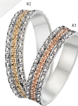
83 Alliance fantaisie diamantée Deux ors