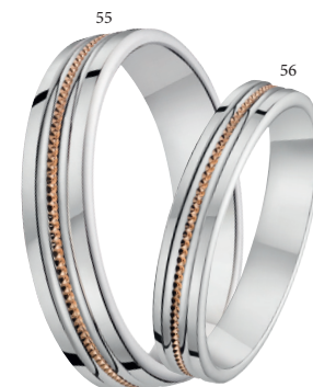
56 Alliance fantaisie polie/perlée Deux ors