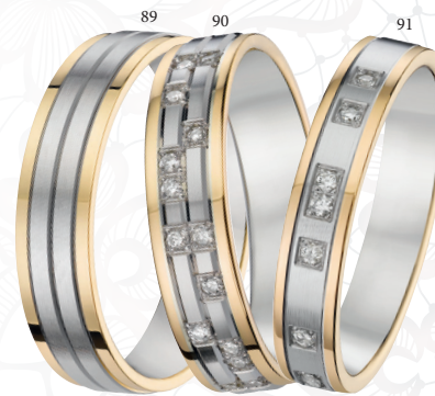
89 Alliance fantaisie polie/brossée Deux ors