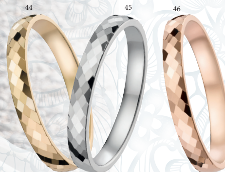
44 Alliance fantaisie polie Or jaune