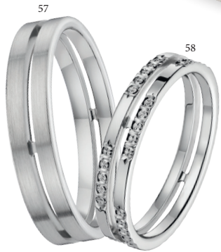
57 Alliance fantaisie ajourée brossée Or blanc