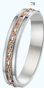
78 Alliance fantaisie diamantée polie Deux ors