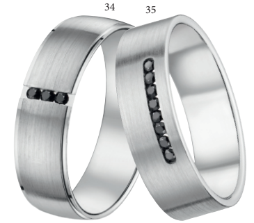
34 Alliance brossée 3 diamants noirs 0.04 ct Or blanc