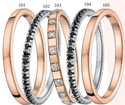
102 Alliance polie tour complet 40 diamants noirs 0.20 ct Or blanc