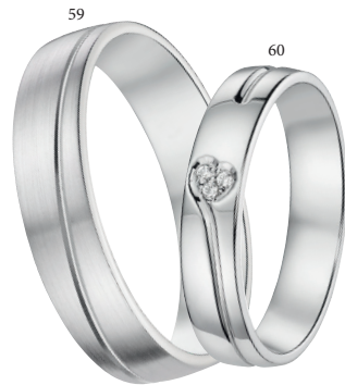
59 Alliance fantaisie brossée Or blanc