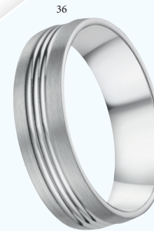
36 Alliance brossée/polie Or blanc