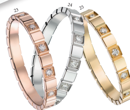
23 Alliance sertie 13 diamants 0.22 ct Or rose