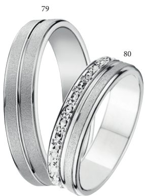
80 Alliance fantaisie polie/sablée Or blanc