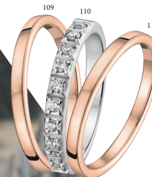
109 Alliance polie classique ruban bombé confort Or rose