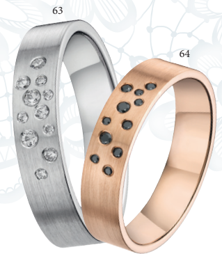
63 Alliance brossée 11 diamants 0.09 ct Or blanc