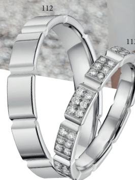
112 Alliance fantaisie polie Or blanc