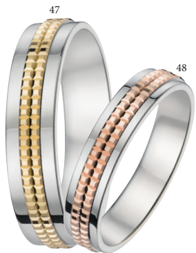
47 Alliance confort fantaisie Deux ors