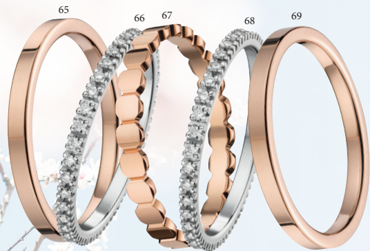
65 Alliance polie ruban confort Or rose